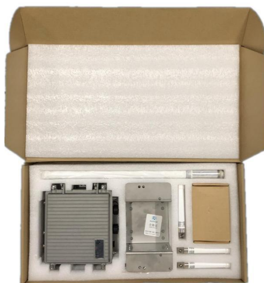
Figure 5- 3 TJ2S208 包装内衬